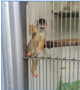
ポリビアリスザル(あっちくん)