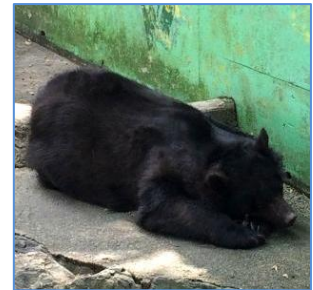
ツキノワグマ(ベニーちゃん)

我々和歌山県民にとっても大変馴染み深い動物園。皆様も和歌 山に訪れる機会があれば、是非、この「 お城の動物園 」にお立ち 寄り下さい。