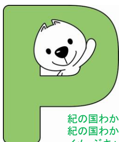
紀の国わかやま国体 紀の国わかやま大会 イメージキャラクターきいちゃん