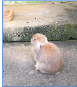
ロップイヤー(チョコちゃん)