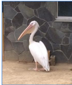
モモイロペリカン(モモくん)