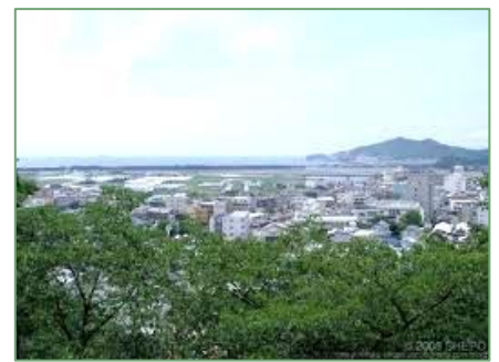
境内から眺める和歌の浦

また、この紀三井寺は、近畿地方や本州に春の到来を告げる「早咲き桜」の名所としても有名で、 日本さくら名所百選 にも選ばれています。紀三井寺の境内には約500本の桜の木が植えられており、開花宣言の目安となる標本木（ソメイヨシノ）が本堂前にあることから、「 近畿地方に春を呼ぶ寺 」として、3月の半ばともなると、地元和歌山県民のみならず、マスコミ等からも注目を集めています。